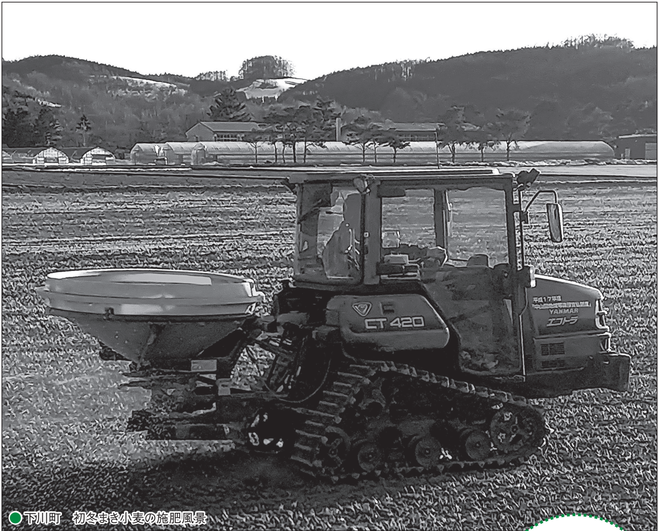
●下川町 初冬まき小麦の施肥風景